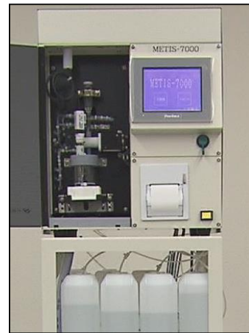
装置本体イメージ