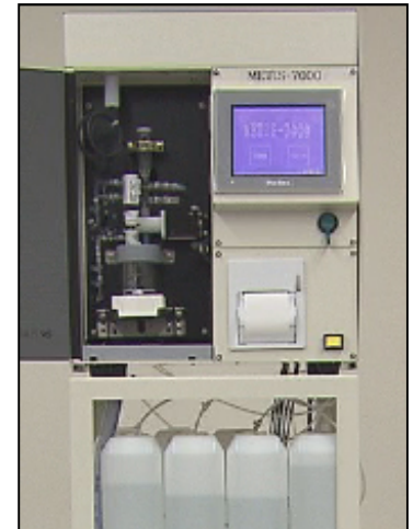
装置本体イメージ