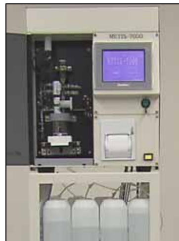
装置本体イメージ写真