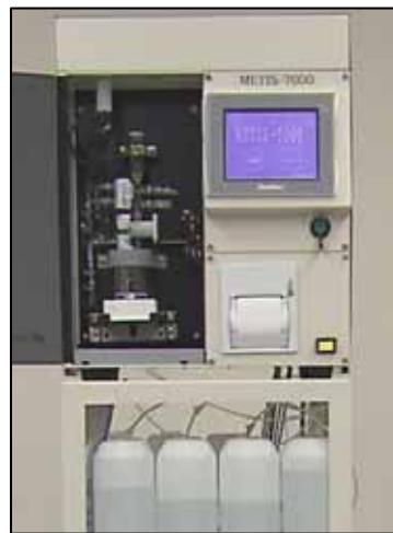
装置本体イメージ