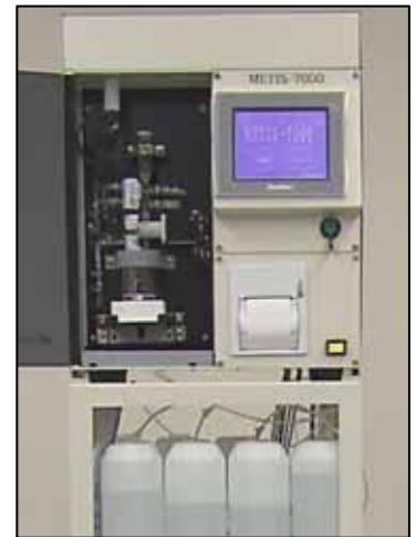
装置本体イメージ