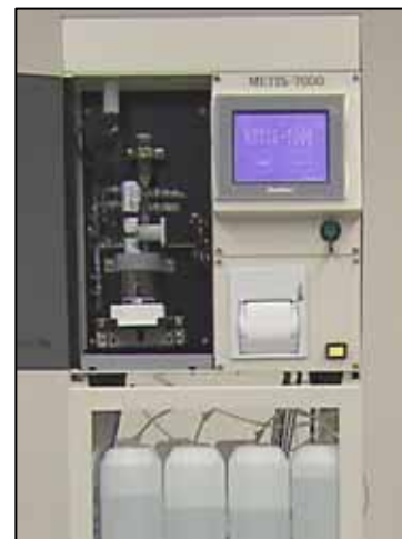
装置本体イメージ