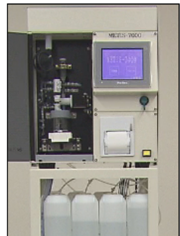
装置本体イメージ