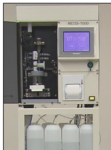
装置本体イメージ