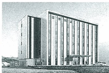
4月に完成予定の「神戸工場」

できないほど」とうれしい悲鳴を上げる。もちろん、地道な企業努力あつてこそ、好業績。毎年製品売上高の約10%を研究開発投資にづぎ込んでいる。 顧客の海外進出に合わせ、2005年に上海に駐在員事務所を開設。日系企業に加え、現地企業、欧米からの進出企業にも販路を拡大してきた。昨年6月には、経済成長著しいASEAN地域の拠点としてタイ にも駐在員事務所を新設した。長年研究開発を進めてきた技術が、いよいよ実用段階に。4月に神戸市西区に「ワールドワン」の製品を生み出したい」と意欲を燃やす。