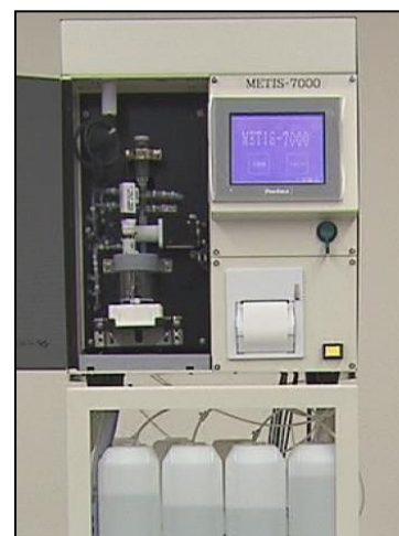
装置本体イメージ写真