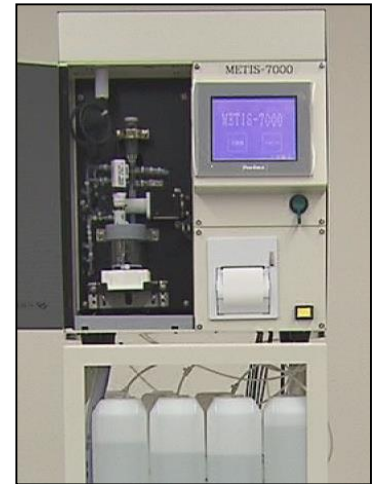
装置本体イメージ